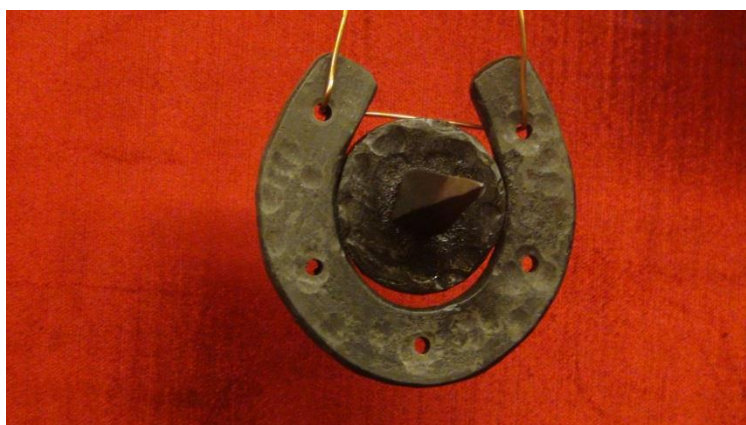
Рис. 1. «Печать конокрада» (Музей, инв. № 13).

Таким образом, в Западной Сибири использовались преимущественно «легкие» виды пыток, большинство из которых представляли собой превентивную меру от побегов. В качестве иллюстрации инквизиционного наказания Германии приводим «Печать конокрада»: в пятку вбивали гвоздь с навешанной на него подковой, после чего наказанный больше не мог передвигаться на ногах.