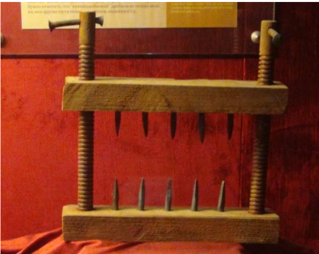
Рис. 3. Коленодробилка (Музей, инв. № 15).

Данные таблицы и иллюстраций показывают, что инквизиционные практики Германии были значительно более опасными для народов Севера, чем пенитенциарная система России, а вхождение Западной Сибири в состав православного государства предотвратило реализацию в регионе европейского опыта уголовных наказаний. Однако в целом российское право, как и германское, отнеслось к одной (континентальной, или романо-германской) правовой системе, поэтому в европейской части России заимствование европейских инквизиционных практик было значительно сильнее (Гернет, 1951). Отсутствие многих из них на Севере отражает влияние сложившихся там традиционных представлений.