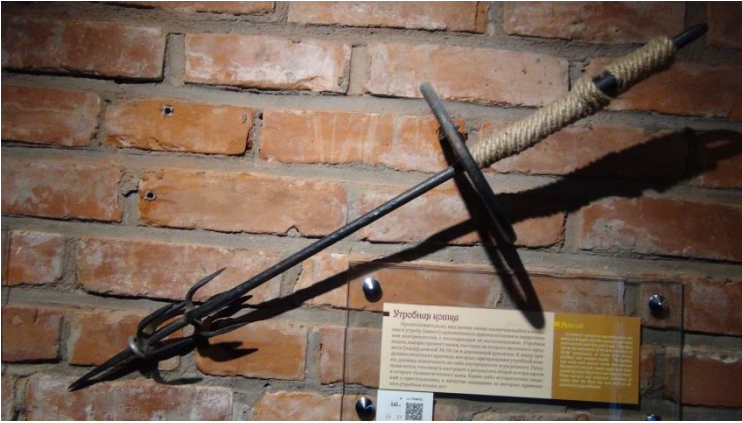
Рис. 2. «Утробная кошка» для вытягивания внутренностей (Музей, инв. № 21).