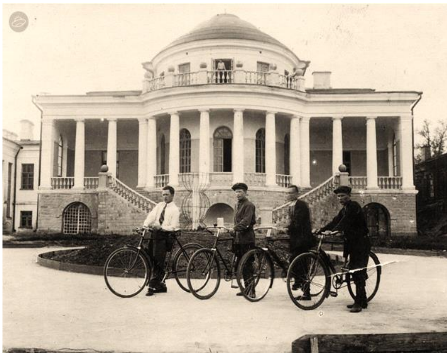
Рис. 2. Усадьба В.Н. Воейкова. Каменка. 1938 г. // Лапшина Е.Г., Ганин Д.С. Проблема реконструкции дворянской усадьбы В. Воейкова в Каменке // Проблемы градостроительной реконструкции. Материалы Международной научно-практической конференции. Самара, 2018. С. 51-58.

На карте сельской дворянской усадьбы прочитывается, что корпуса ансамбля образуют в плане анаграмму В.Н. Воейкова – ВНВ. Три главных здания при этом расположены вдоль общей оси. Вогнутый объем конюшни фланкирует центральное пространство ансамбля. На склоне холма был разбит парк, значительная крутизна позволила устроить террасы с подпорными стенками и парадную лестницу, ведущую к дворцу.